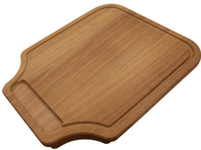
Planche de découpe en bois Iroko 8647 000