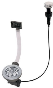
Vidange automatique 8407 000