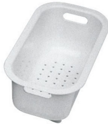
Passoire blanche 8151 100