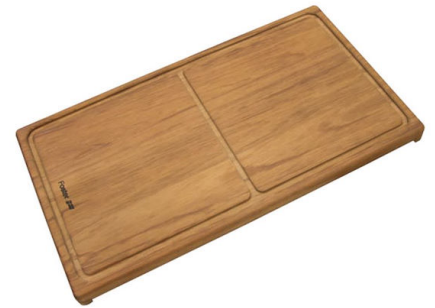
Planche de découpe coulissant Iroko 8643 000